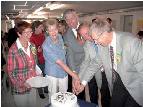
Gemeinsam statt einsam: „Wohnkonzept 12“ auf dem GILDE CARRÉ

Des weiteren wurde die Residenz Nedderntor in Gehrden mit dem Gütesiegel nach der neuen Dienstleistungsnorm für Betreutes Wohnen ausgezeichnet.