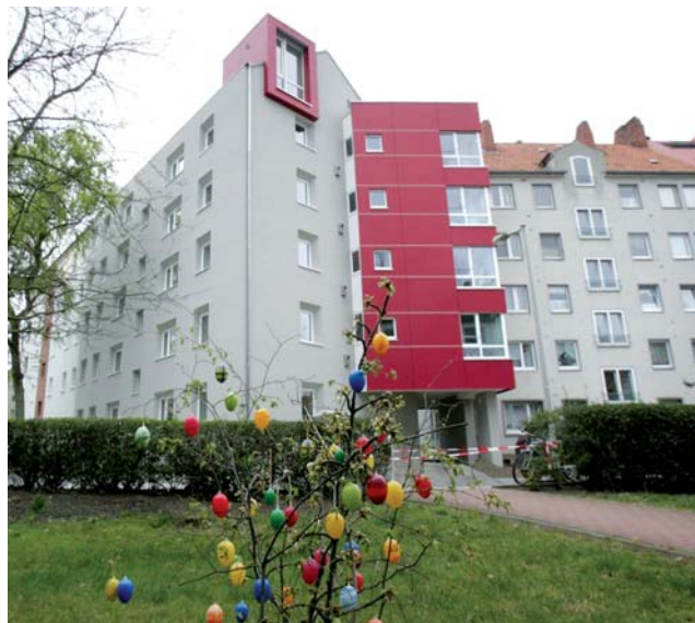
Neues Wohngefühl: Passivhaus Röttgerstr. 22 in Hannover-Linden