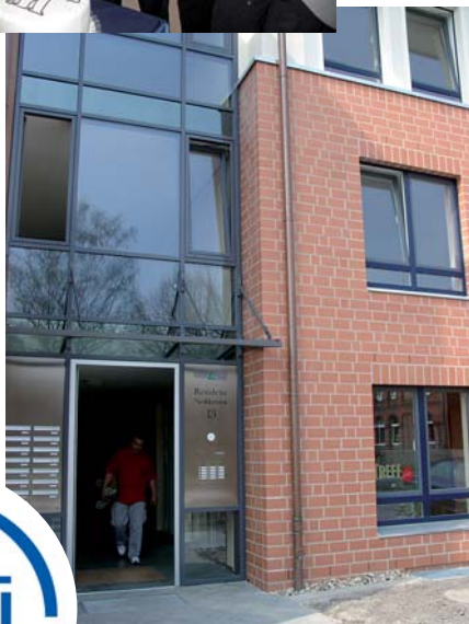
Residenz Nedderntor in Gehrden