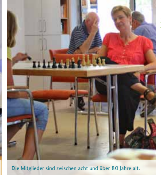
Die Mitglieder sind zwischen acht und über 80 Jahre alt.