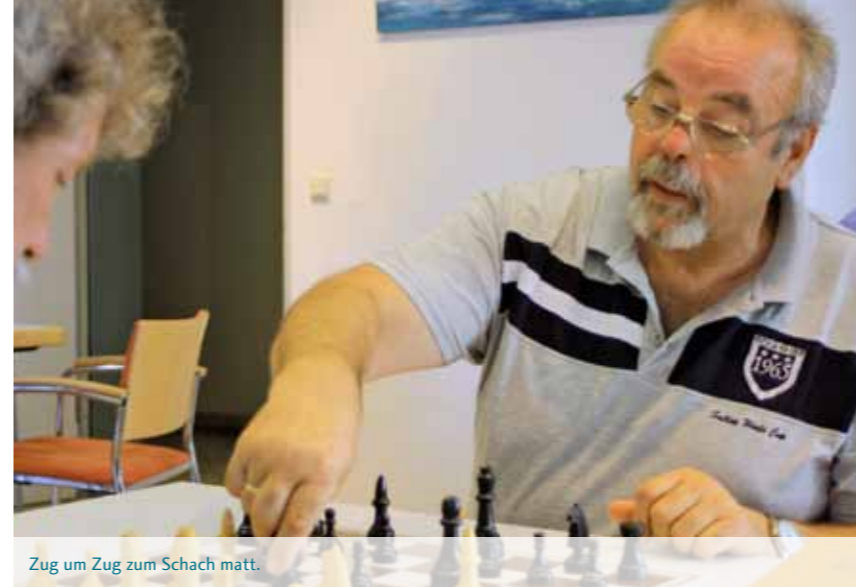
Zug um Zug zum Schach matt.