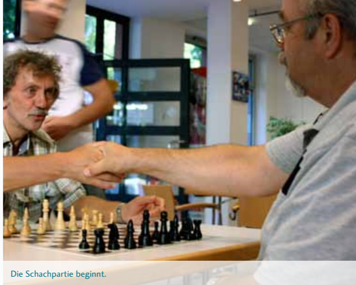
Die Schachpartie beginnt.